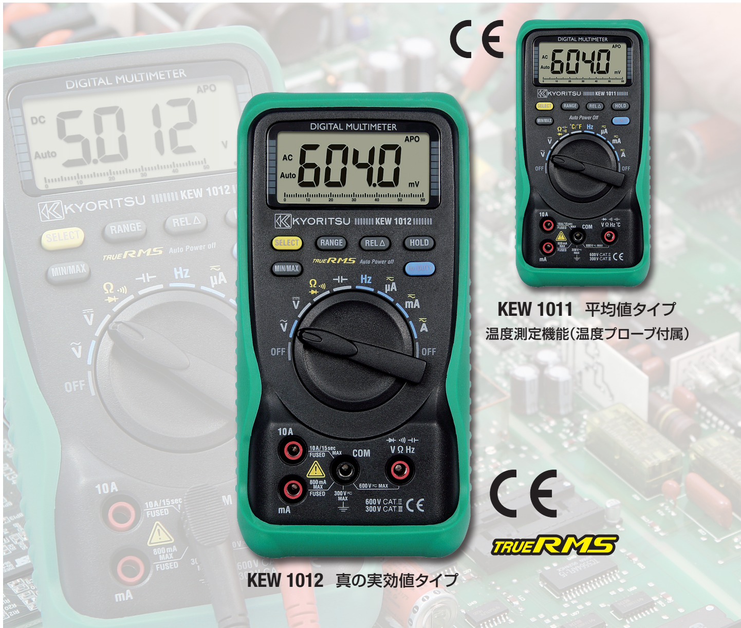
KEW 1011 平均値タイプ 温度測定機能(温度プローブ付属)