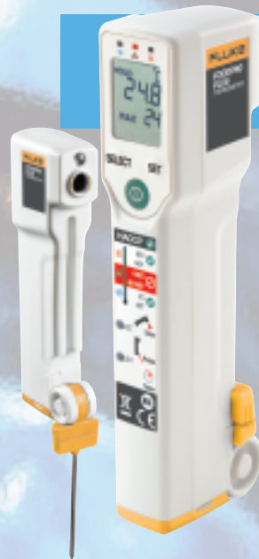
FoodPro Plus フードプロ・プラス温度計

食品の不適切な受入・貯蔵・保温温度の発見に適したフードプロ。表面温度を素早く測定するので、作業者は接触温度計よりも迅速・頻繁に、そして接触汚染の不安なく温度測定が行えます。照射ライトは測定エリア全体を照射するので、どこを測定しているかひと目で視認でき、目標を正確に測定することができます。