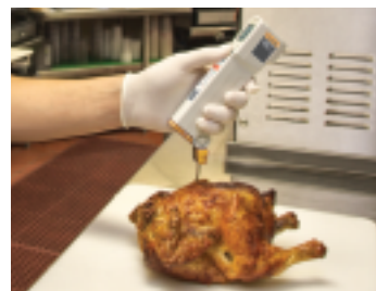
プローブ・モードでの芯温度測定 (FLUKE-FP PLUSのみ)