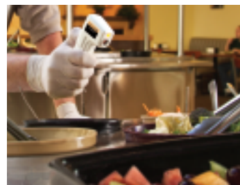
陳列食品の温度検査