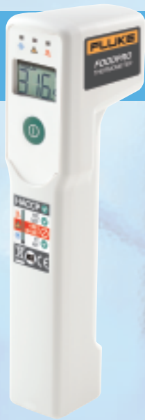
FoodPro フードプロ温度計

フード・サービス業界では、食品の受入から貯蔵・出荷まで正確で迅速な温度モニタリングが必要です。温度モニタリングは食品安全を確保する最も重要な要素であり、米国では食品医薬品局 (FDA) によって義務付けられています。日常の温度モニタリングと食品安全ガイドラインの順守は、食品安全の向上、廃棄食品の削減など、より良いビジネス展開へと導きます。Flukeフードプロ温度計シリーズは、非接触式による迅速かつ安全測定で食品温度管理業務をサポートします。