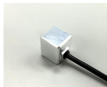
ZMP® IMU-Z Cube