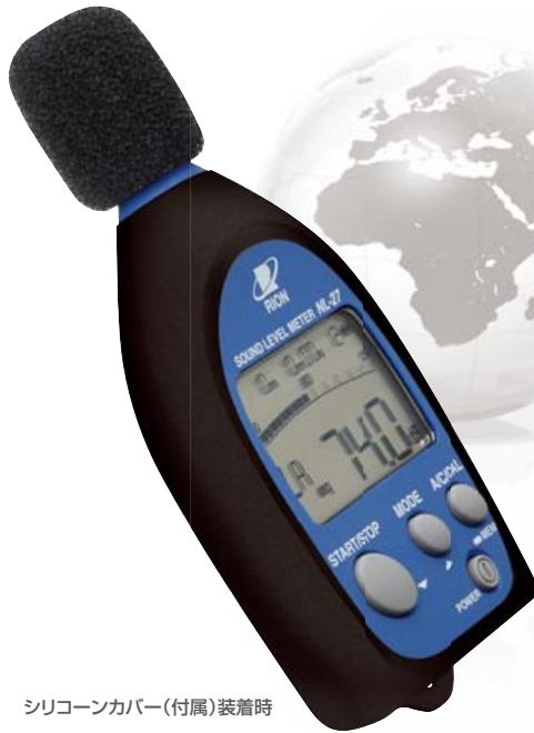
シリコンカバー(付属)装着時