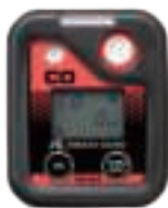
プロテクトカバー: 1個 部品番号: 4123 6450 20