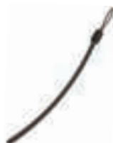
ハンドストラップ 部品番号: 0888 0605 90