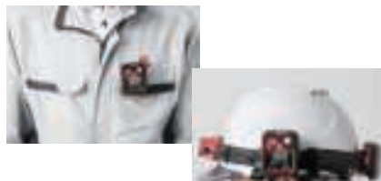
ヘルメット上のバンドに装着したイメージ