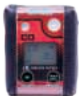
耐熱ケース*1 部品番号: 4732 5029 70