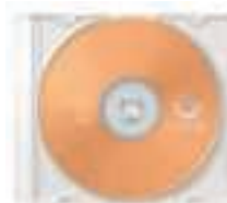
データログ管理プログラム 部品番号: 9811 0930 30