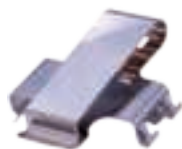
ベルトクリップ: 1個 部品番号: 4123 6463 30