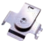
ヘルメット用クリップ*2 部品番号: 4732 4978 10