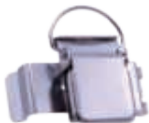
アリゲータークリップ 部品番号: 4711 7111 10