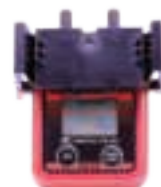
校正キャップを取り付けたイメージ