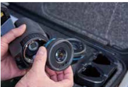
AutoCal™ 光学によりシリーズの全カメラでレンズ (広角から望遠) の共有が可能