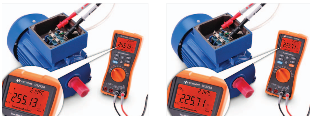
図1. 産業用モータVFDからの電圧出力を比較しています(ローパス・フィルタ機能を使用した場合(左)としない場合(右))。

U1270シリーズは、1 kHz LPF(ローパス・フィルタ)を搭載し、高周波ノイズや高調波を除去することが可能です。これにより、例えばVFD(可変周波数ドライブ)の正確な測定が可能です。