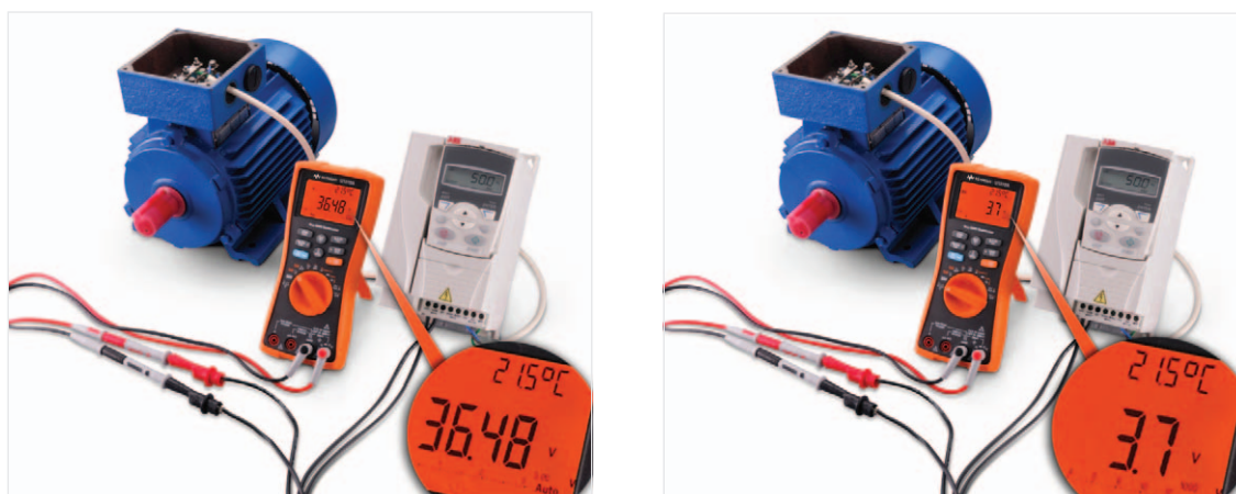
図2. 産業用モータのVFDに電源を供給する配線と平行して非接続状態の配線がある場合は、この配線で浮遊電圧が発生しているかどうかを確認できます。右の図は、低入カインピーダンス・モードでの測定値(浮遊電圧成分を含まない)です。

U1270シリーズのピーク検出機能により、エンジンやモータ始動時の過渡信号(最速250 \mu s)を捕捉できます。