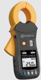
クランプ接地抵抗計 FT6380-50