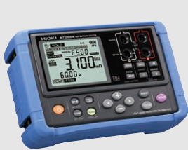
バッテリーテスタ BT3554-50