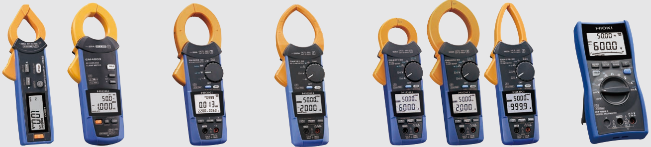
ACリーククランプメータ CM4001, CM4002 CM4003