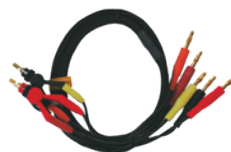
ケルビンプローブ (4 線式抵抗測定用) [DME1600-OPT07] ¥25,000 (税込 ¥27,500)