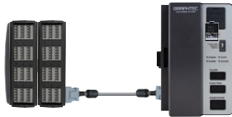
拡張端子接続ケーブル B-567 シリーズ