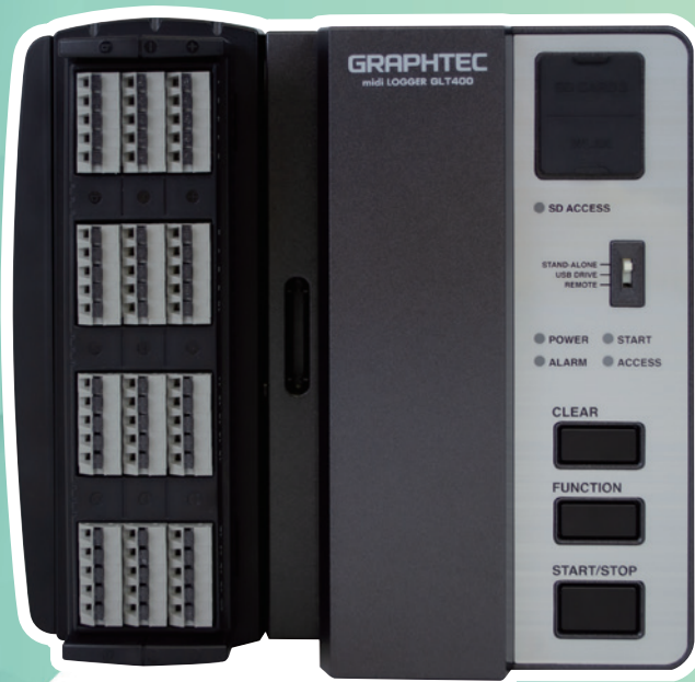
* 上記イメージは、 本体 + スクリューレス端子 (B-564SL) + 拡張端子 (B-566) 装着時