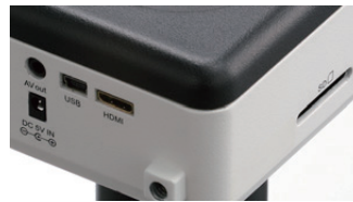
マルチ出力端子とSDカードポート

* SDカードは付属していません。別途ご購入ください。SDカードはSDHCまで(32GBまで)が対応しております。もっと容量のあるもの(SDXC)は対応しておりませんので、ご注意ください。